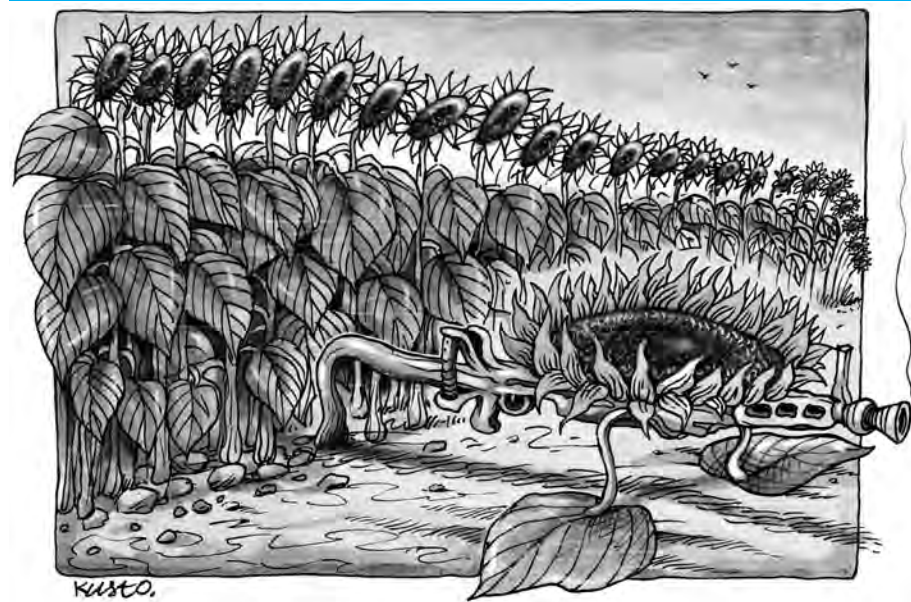
На бойовому чергуванні.